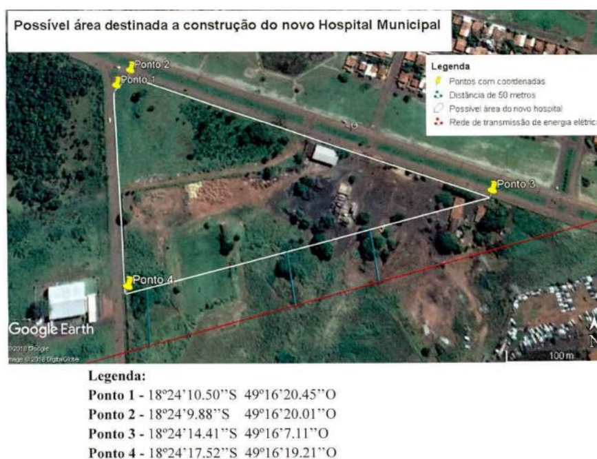
Figura 4. Área destinada à construção do novo Hospital no município de Itumbiara.