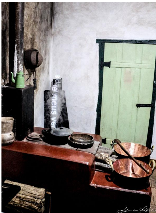
Figura 3 – Cozinha de Cora Coralina