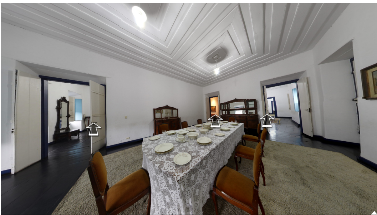
Figura 4 – Sala de Jantar do Museu do Palácio Conde dos Arcos

Na sala de jantar, ou ainda, o espaço onde ocorriam as refeições, era dotada de outra configuração. Esses aspectos de layout dos espaços é importante, sobretudo, por demonstrar a dualidade entre os que deveriam e poderiam ocupar estes espaços (PÉCLAT, 2008). A imagem 2 demonstra, a título de exemplo, a configuração de uma sala de jantar tradicional na Cidade de Goiás.