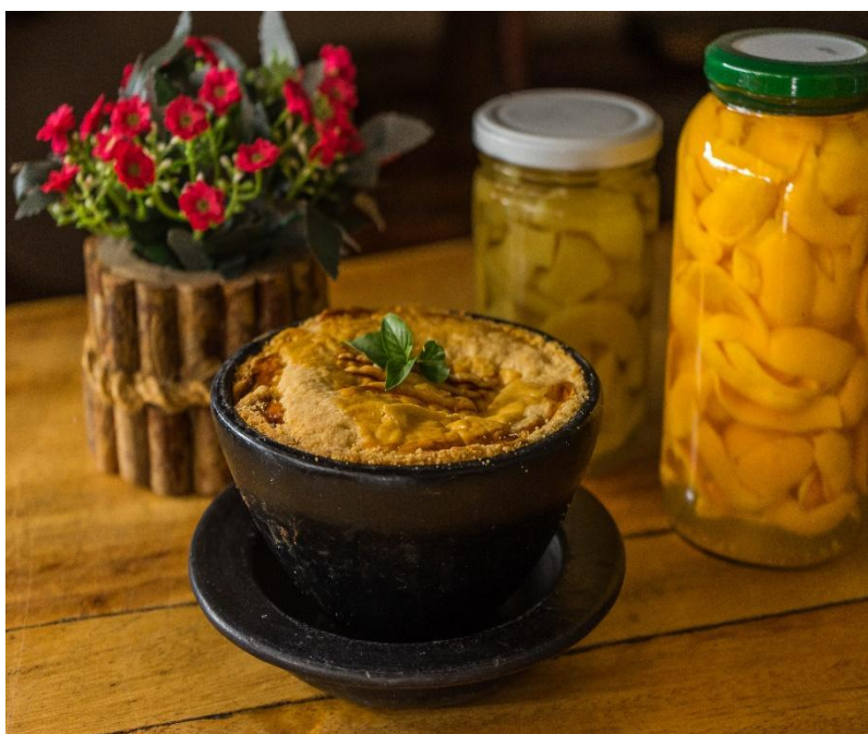
Figura 2 – Empadão Goiano da Cidade de Goiás

O preparo do empadão goiano envolve uma série de saberes e fazeres transmitidos de geração em geração. Cada cozinheiro coloca seu toque pessoal, utilizando ingredientes frescos e selecionados. A massa do empadão, por exemplo, pode ser feita com farinha de trigo, gordura de porco e um toque de cachaça, resultando em uma textura e sabor únicos. Essas singularidades aparecem na Cidade de Goiás como um processo que dispõe de relações e dinâmicas simbólicas, como a memória, os afetos, a identidade familiar, entre outros (MARTINS, 2022).