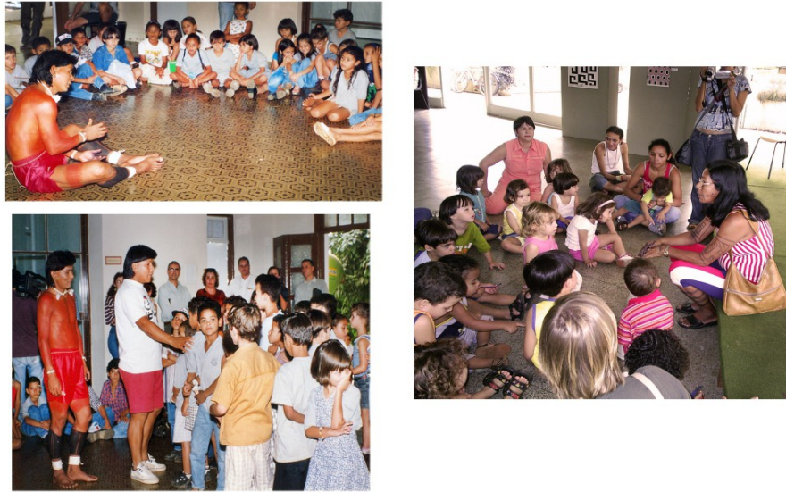
Ilustração 05: Sem descrição.