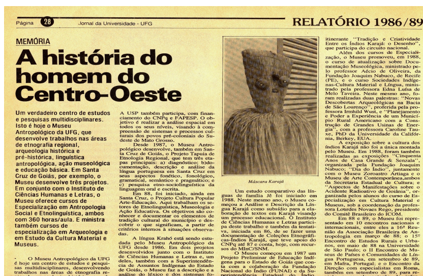
Ilustração 13: Jornal - A história do homem do Centro-Oeste, 1986/1989