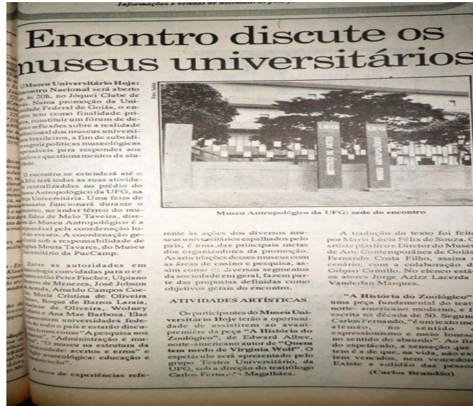
Ilustração 15: Jornal- Encontro discute os museus universitários, 1992