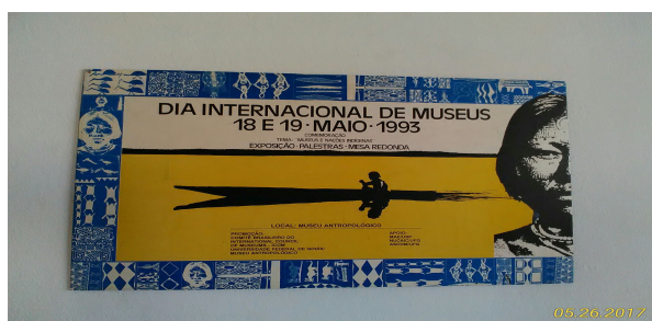
Ilustração 20: Painel- Dia Internacional de Museus, 1993