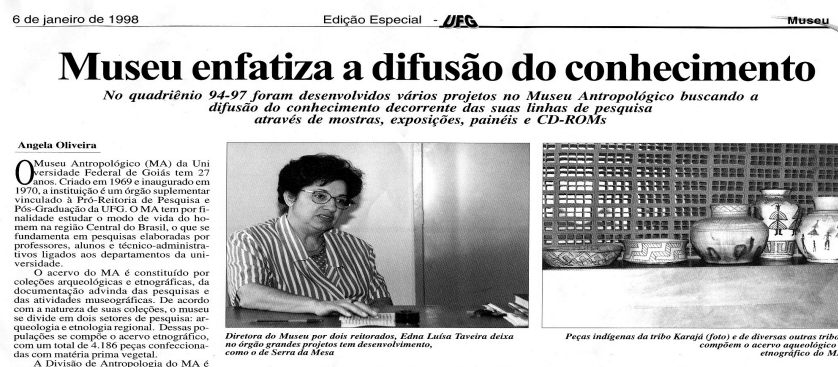
Ilustração 08: Jornal-Museu enfatiza a difusão do conhecimento, 1998