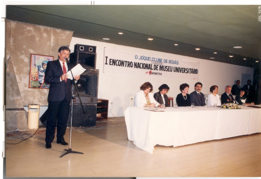
Ilustração 14: Abertura do I Encontro Nacional de Museus Universitários, 1992