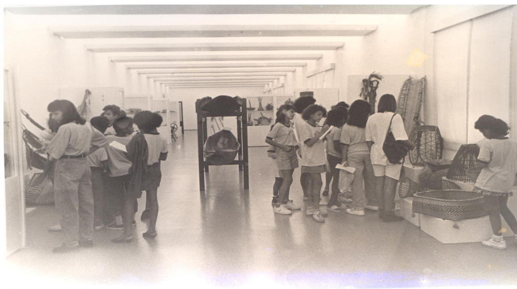
Ilustração 24: Exposições de Antropologia