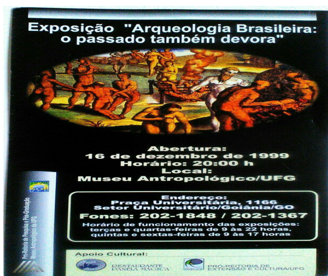
Ilustração 26: Folder-Exposição Arqueologia Brasileira: O passado também devora

Tais cuidados puderam ser observados na comunicação através da linguagem clara e objetiva. A temática oportuna possibilitou reflexões ao público, pois o Brasil estava próximo a completar 500 anos da chegada dos portugueses ao Brasil. A preocupação entorno da exposição e do público se condicionou a estudos sobre vários aspectos da arqueologia brasileira e da museografia. A museografia se aplica a “aspectos técnicos de instalação das coleções, climatologia, arquitetura do edifício, aspectos administrativos entre outros” (HERNANDEZ, 2001, p. 70. Tradução da autora).