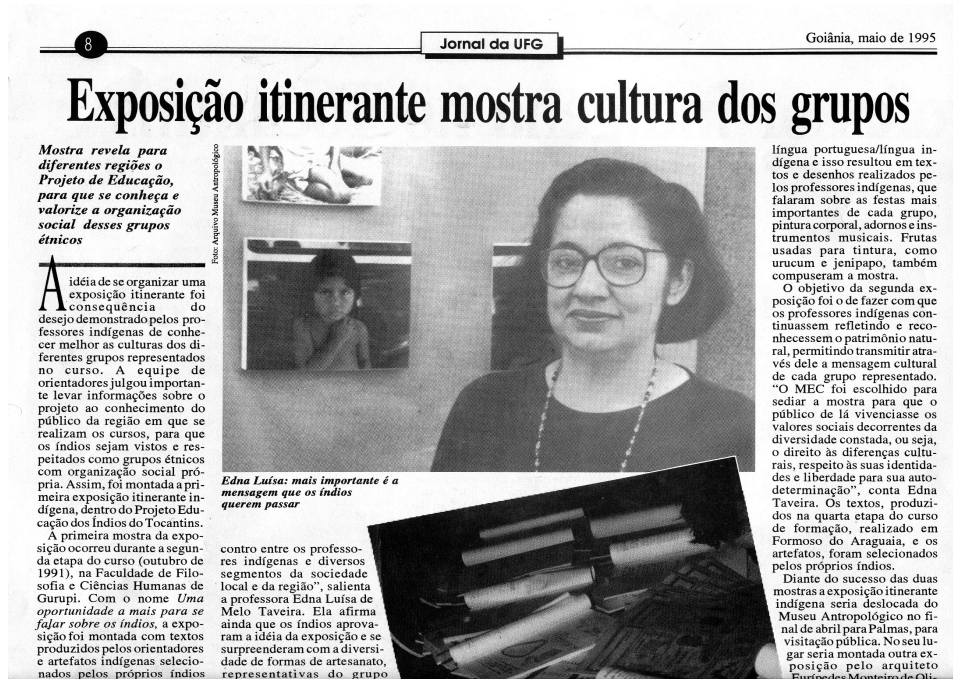
Ilustração 11: Exposição itinerante mostra cultura dos grupos, 1995