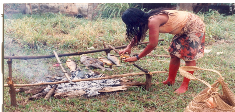
Ilustração 16: Assando Peixe - Kraô, 1992

Fonte: Acervo do Museu Antropológico/ UFG. Foto: Autor desconhecido, 1992