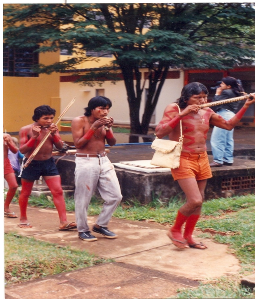
Ilustração 17: Índios tocando instrumentos musicais - Kraô, 1992