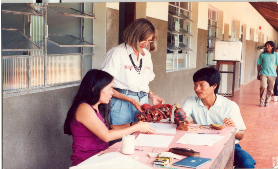
Ilustração 12: Coleta e registro de material para exposição, 20/11/1991