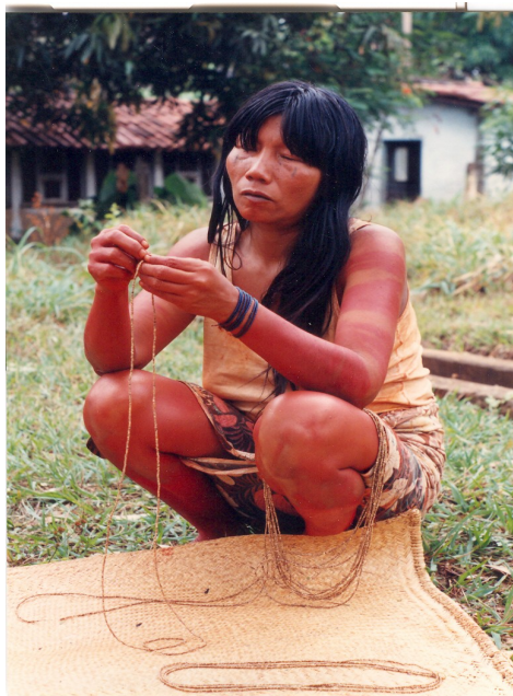
Ilustração 19: Índia de cocaras-Kraô, 1992