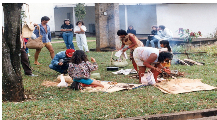
Ilustração 18: Exposição de material Indígena-Kraó, 1992