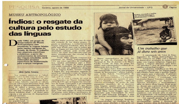
Ilustração 07: Jornal-Índios: o resgate da cultura pelo estudo das línguas, 1988