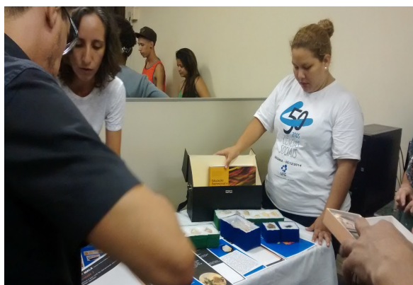
Ilustração 21: Oficina - Mala Arqueológica. 13º Semana de Museus, 2015

perspectivas para o século XXI que norteiem os rumos quanto ao papel do museu para as sociedades.