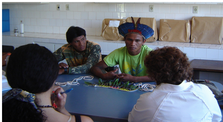
Ilustração 06: Sem descrição.