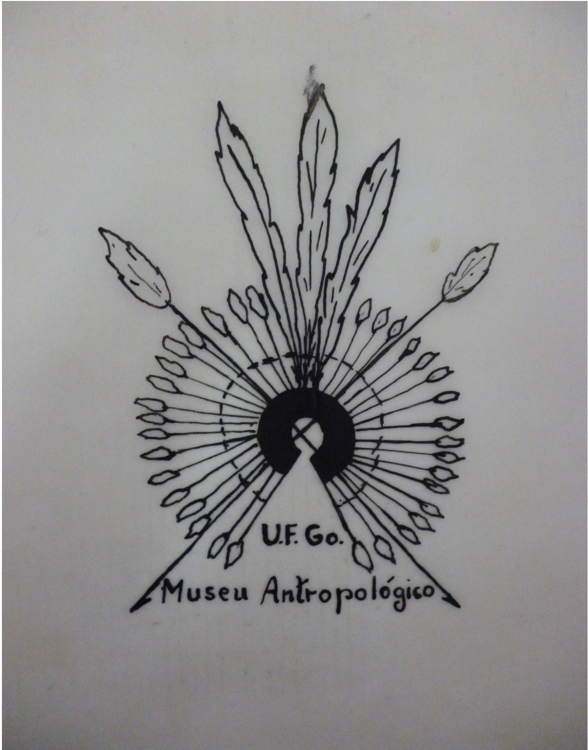
Ilustração 01: Desenho/Protótipo da primeira Logomarca do Museu Antropológico da UFG.s/d