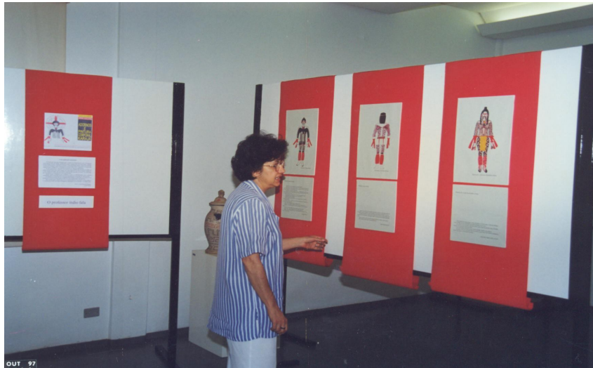
Ilustração 27: Ilustrações - Adornos e Pinturas Corporal Karajá