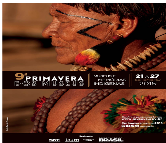
Ilustração 22: Material de divulgação digital. 9ª Primavera de Museus, 2015