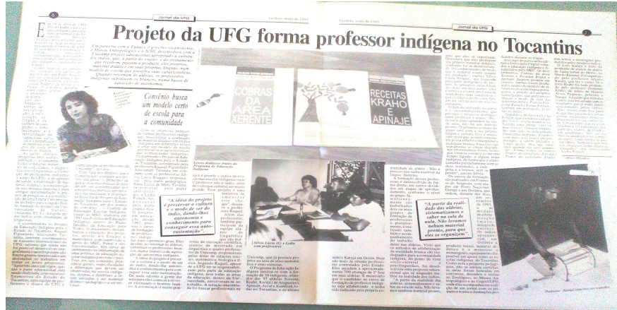
Ilustração 09: Jornal-Projeto da UFG forma professor indígena no Tocantins