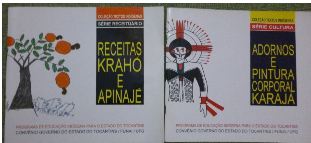
Ilustração 10: Coleção textos indígenas, 1994